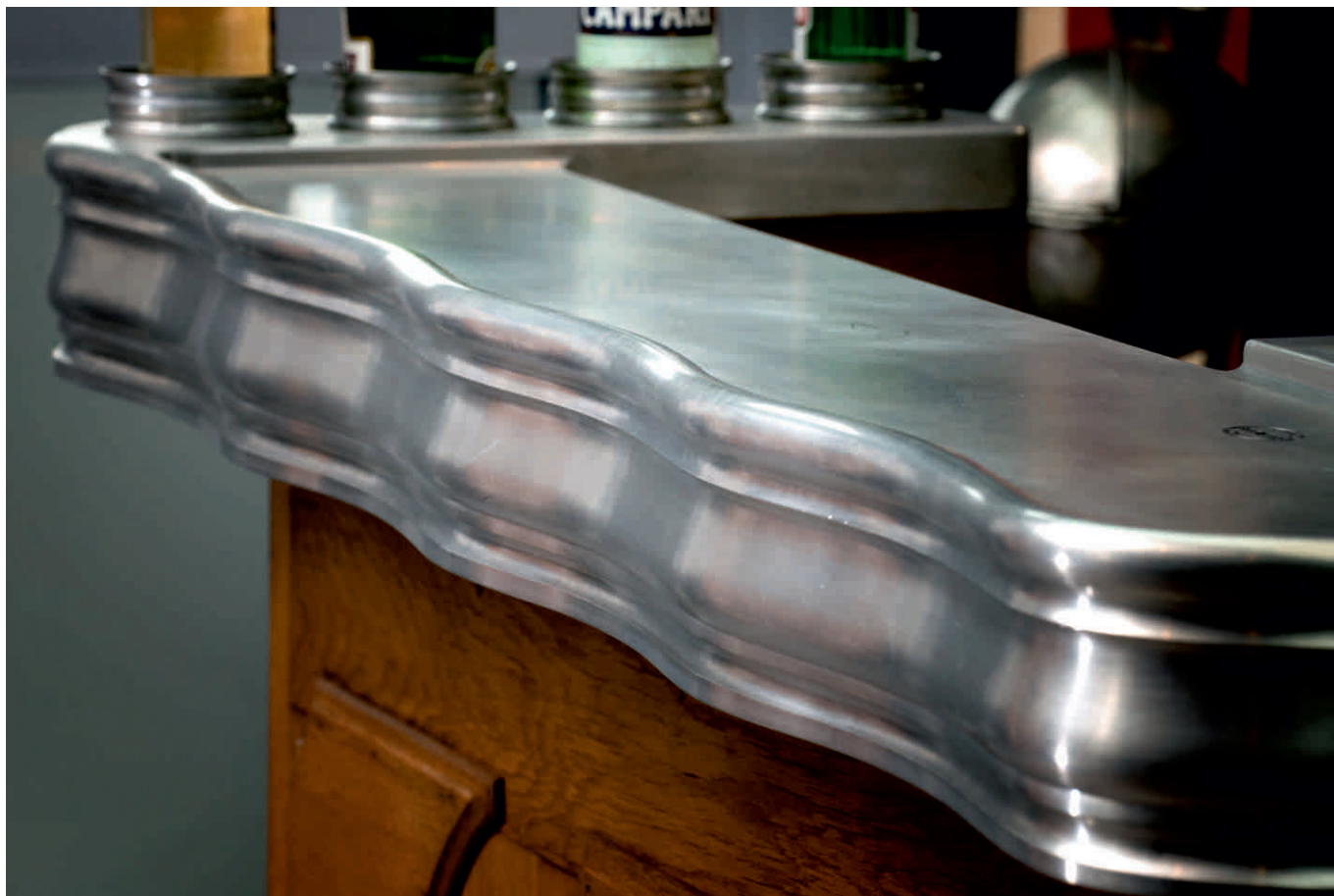
COMPTOIR D'ÉPOQUE 1900 Bordure n°2 montée en vagues