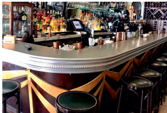
L'EXPRESS, NEW YORK Bordure n°4