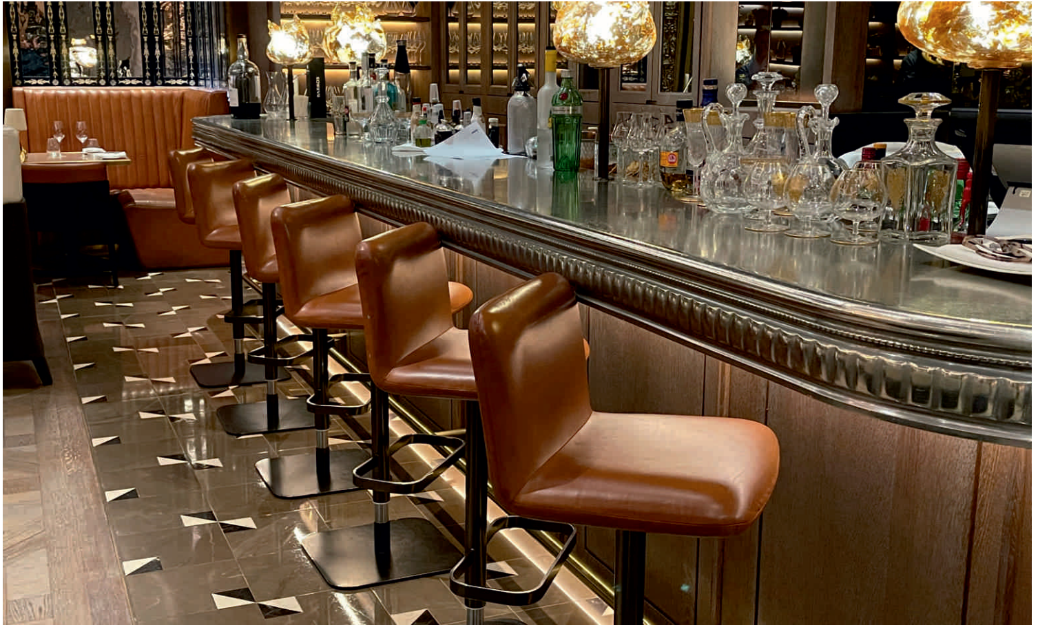
THE DORCHESTER, LONDRES Bordure n°25