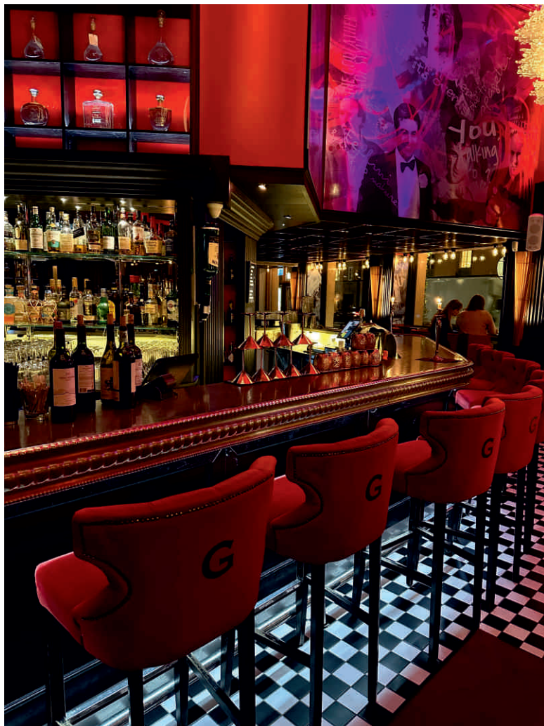
GRAPPA, STOCKHOLM Bordure n°26