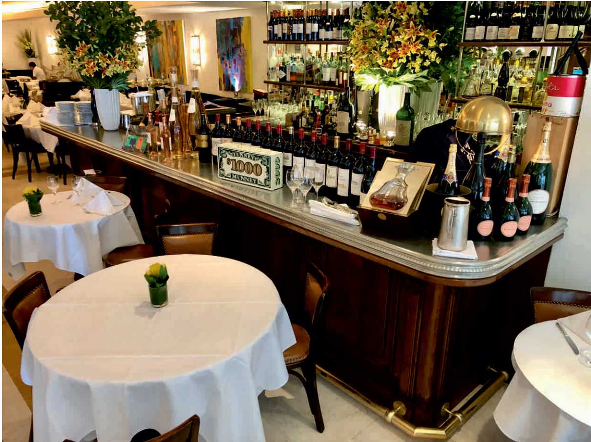
LE BILBOQUET, NEW YORK Bordure n°18