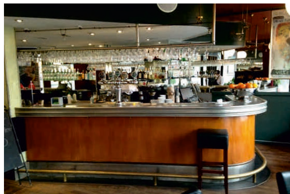
CARLTON, DANEMARK Bordure n°2