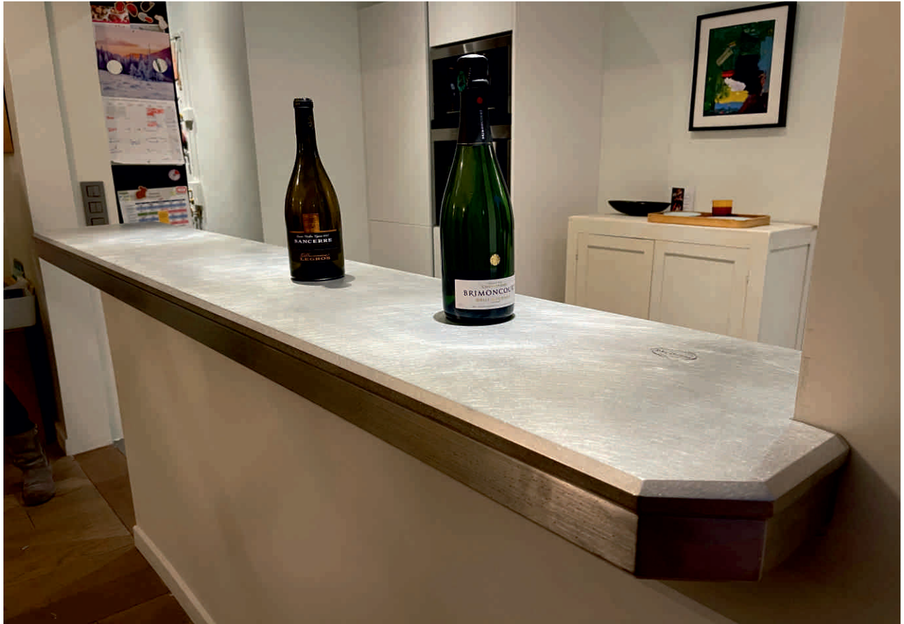
Bordure néo-design n°103