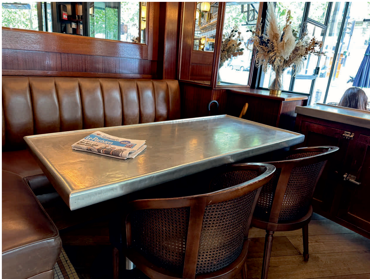
LE DIPLOMATE Bordure sur mesure, demi-ovale