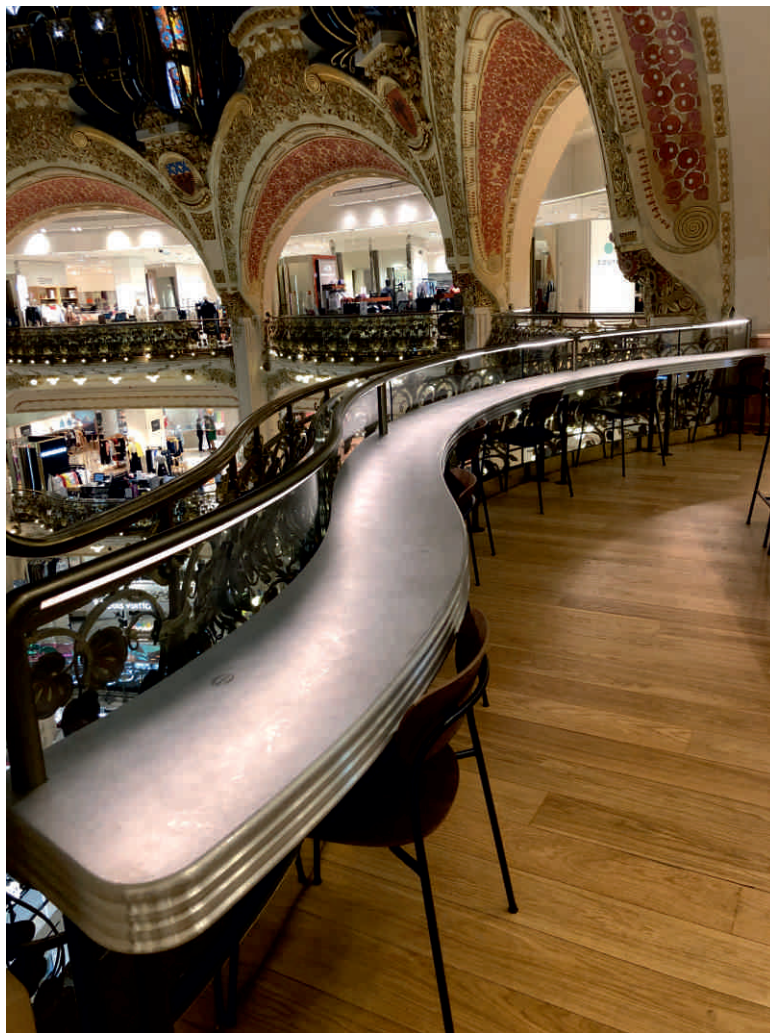
CAFÉ COUTUME, GALERIES LAFAYETTE Bordure n°19