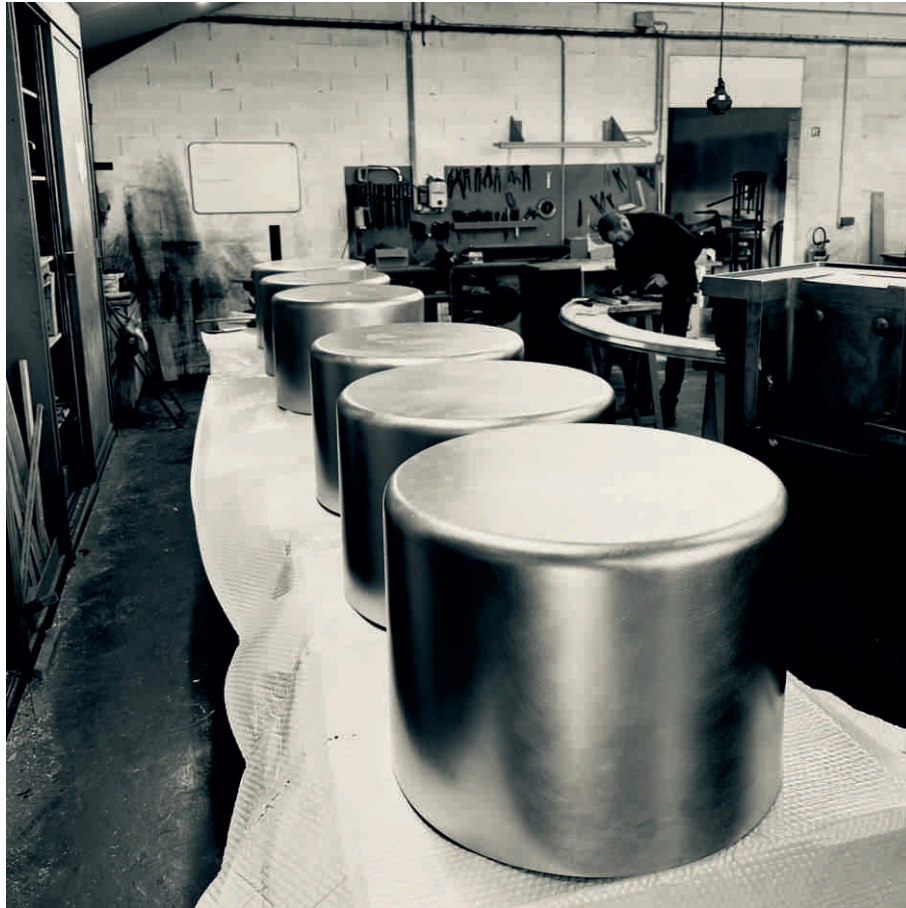
TABLES BASSES ATELIERS