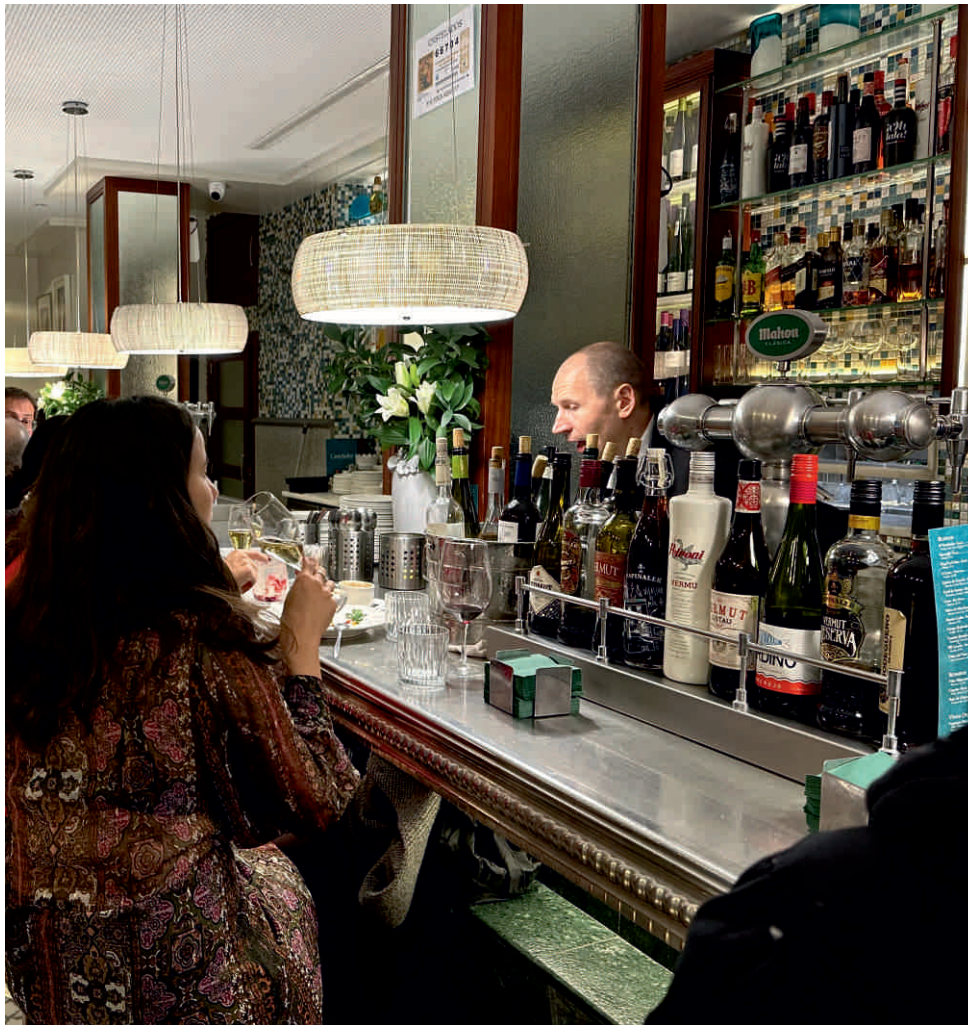
CASTELADOS, MADRID Bordure n°7