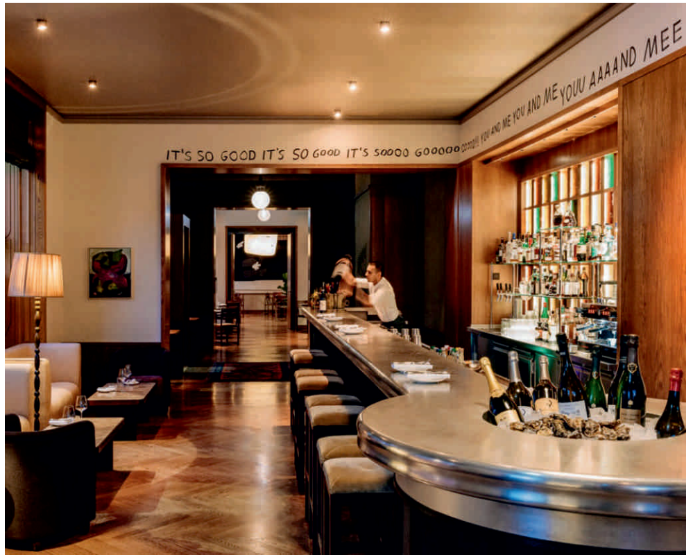
CHATEAU ROYAL, BERLIN Bordure sur mesure