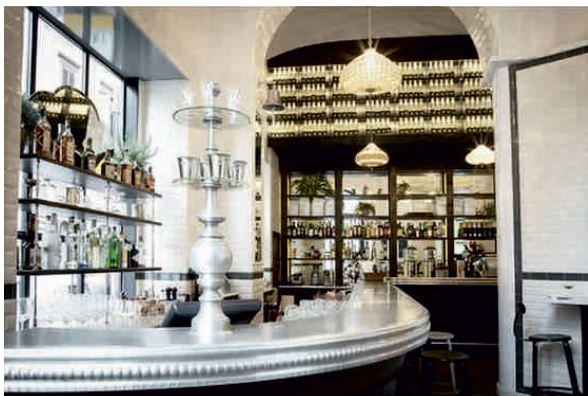
PROPAGANDA, ITALIE Bordure n°7