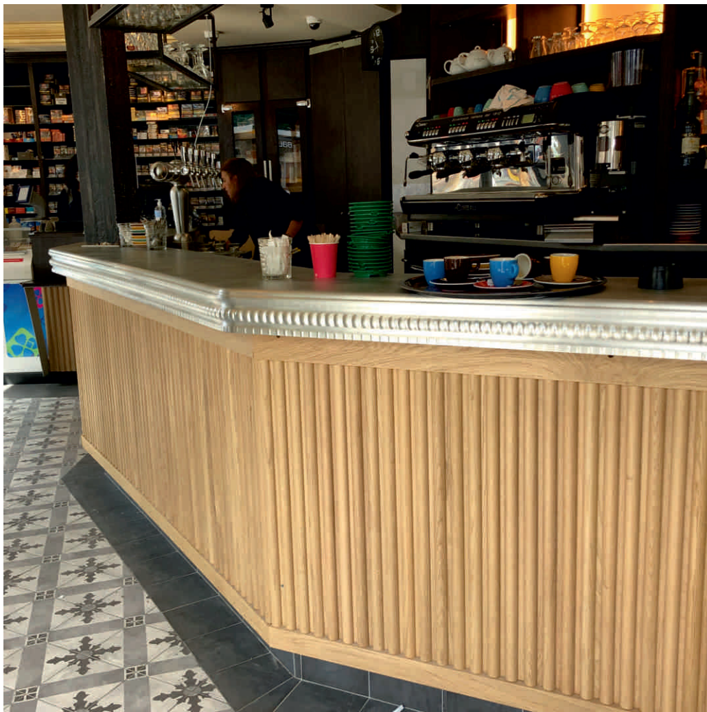
CAFÉ DE L'ÉGLISE Bordure n°7