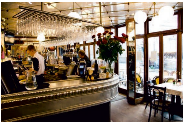
CAFÉ CASABLANCA, DANEMARK Bordure sur mesure