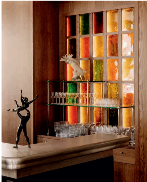
CHATEAU ROYAL, BERLIN Bordure sur mesure