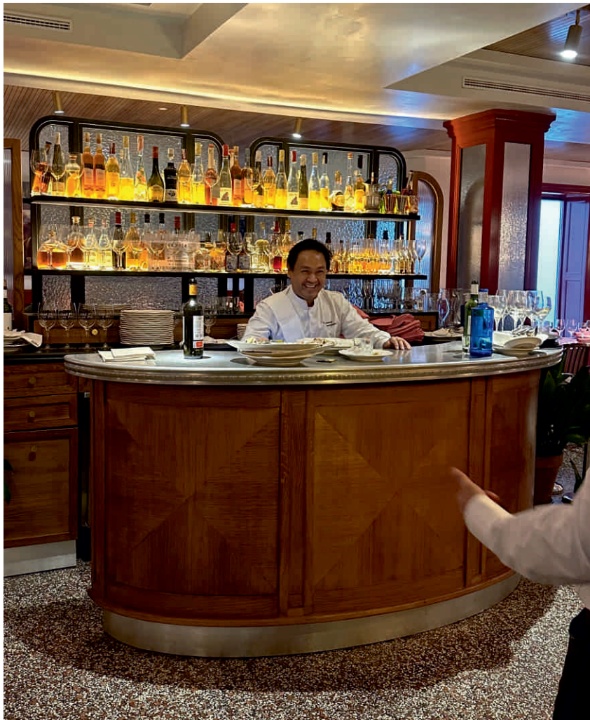
LA CASTELA, MADRID Bordure n°16