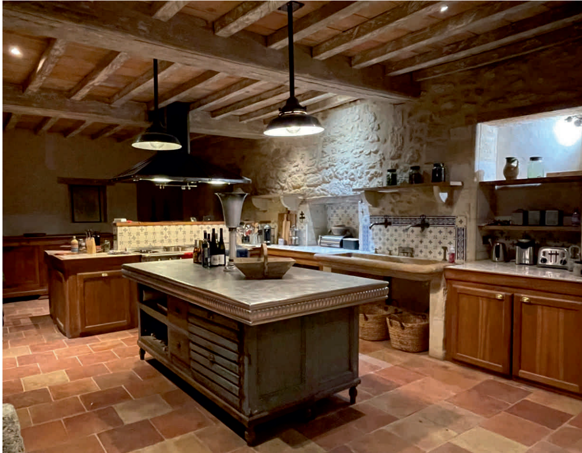
ÎLOT CENTRAL Bordure n°23