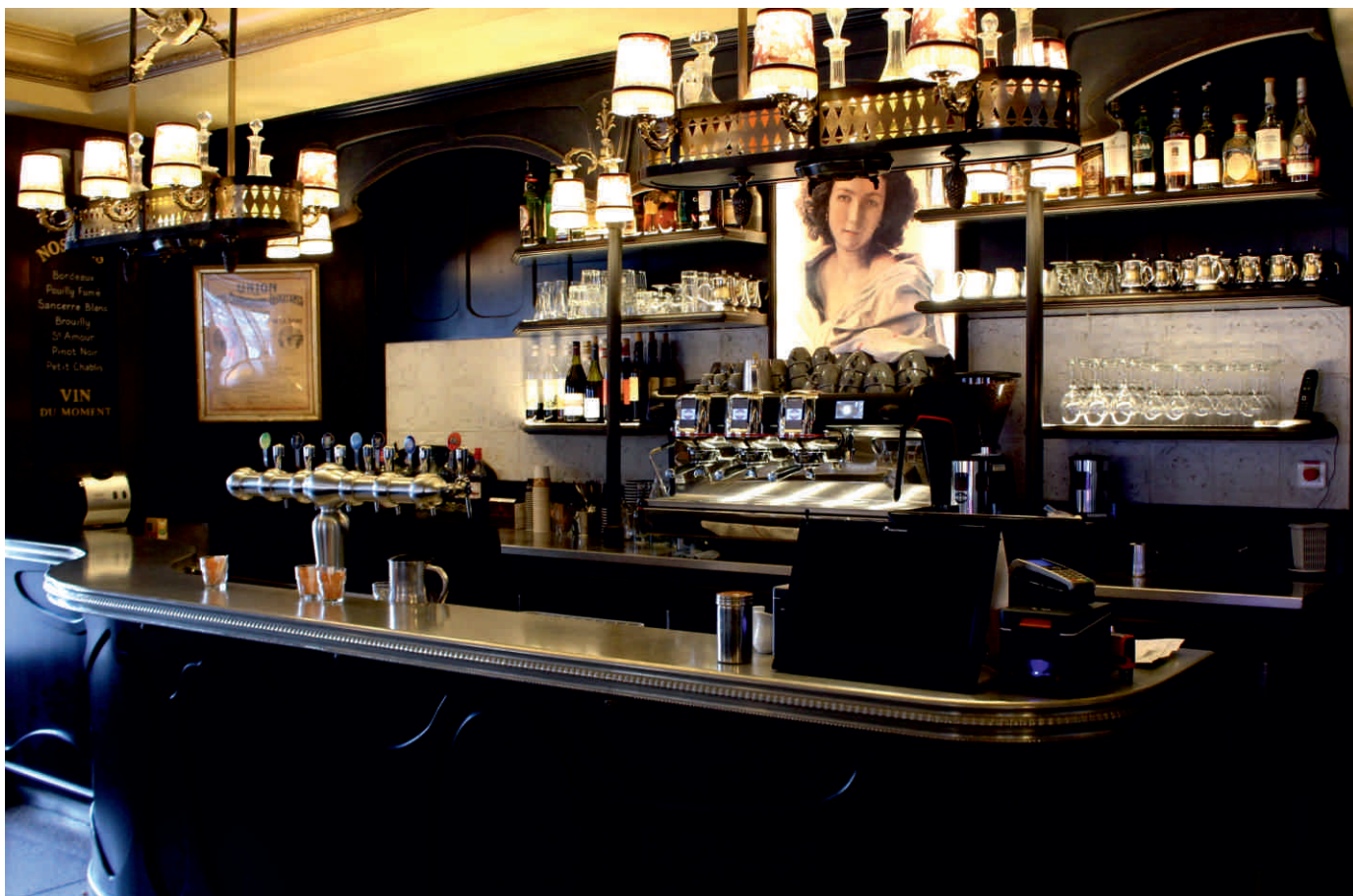
LE SARAH BERNHARDT Bordure n°18