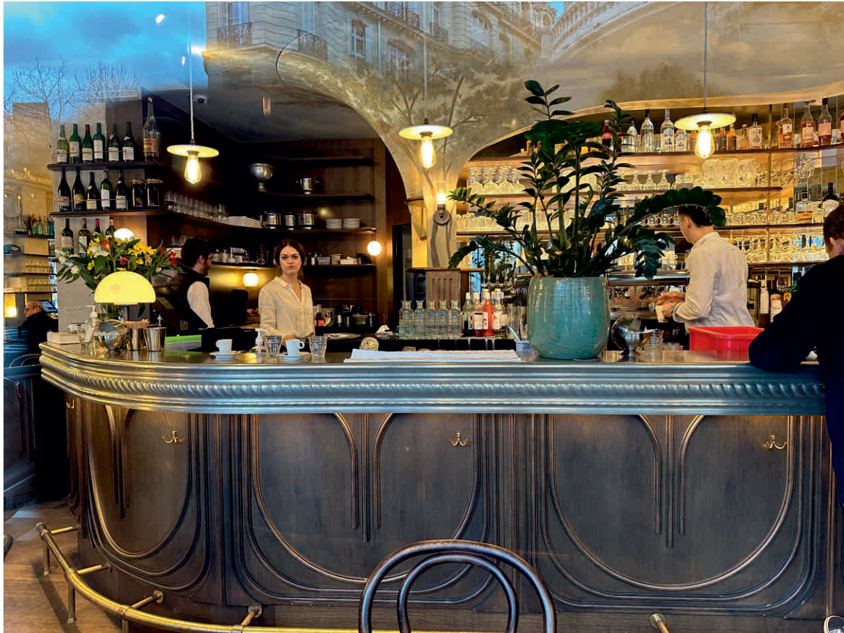
LE CAMPANELLA Bordure n°14