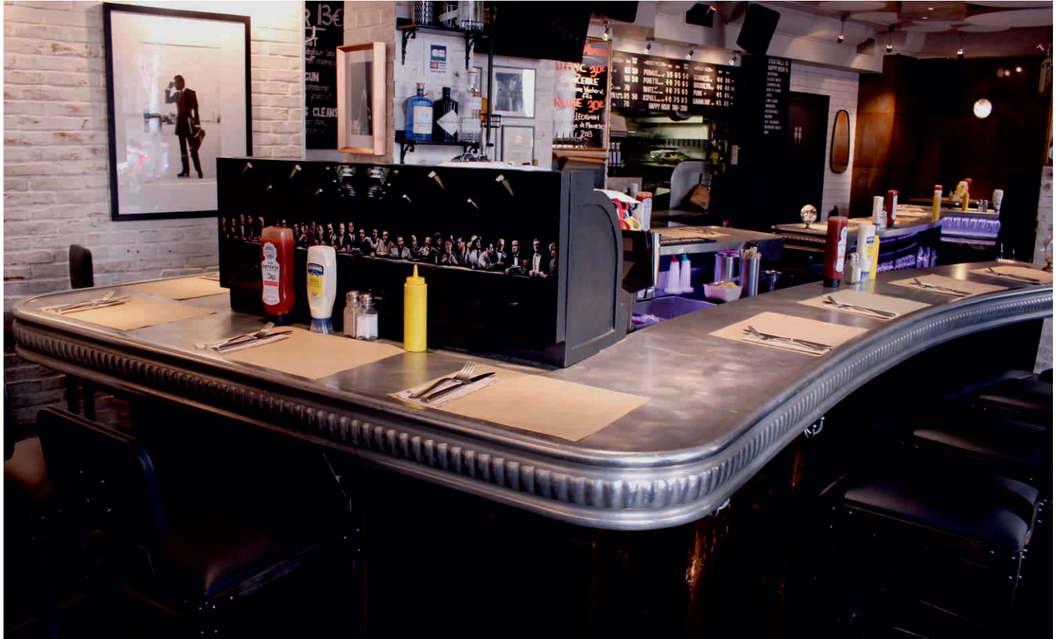
BUGSY'S Bordure n°23