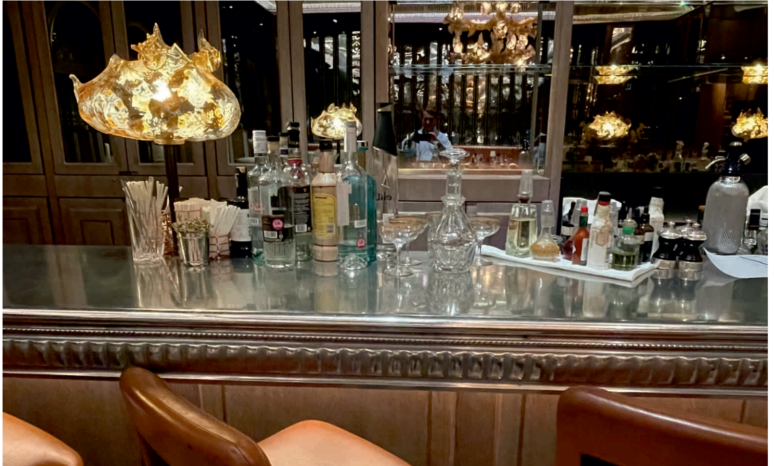
THE DORCHESTER, LONDRES Bordure n°25