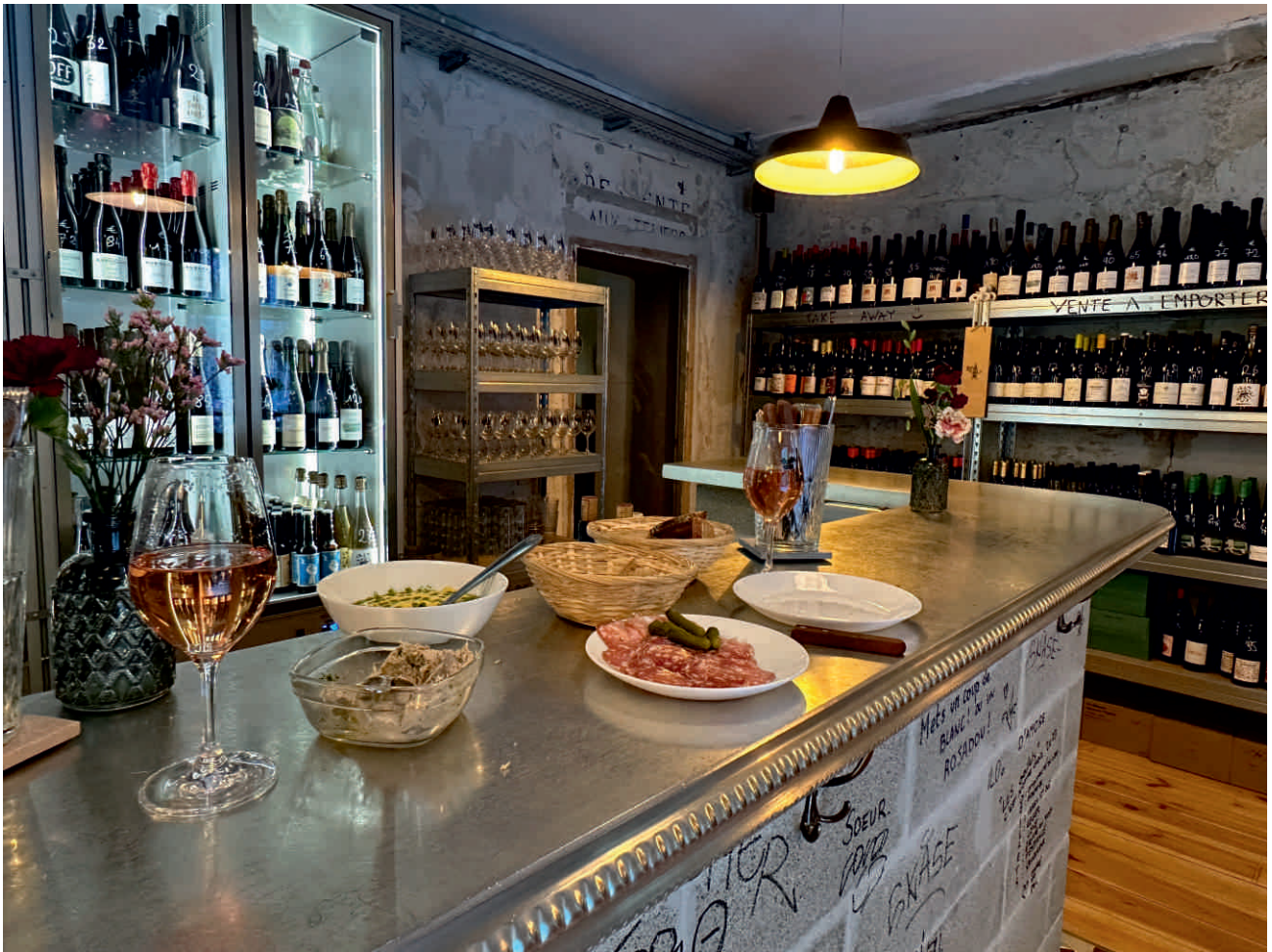
LES OEILLETES Bordure n°11