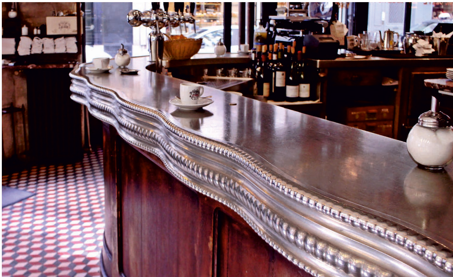
CAFÉ VARENNE Bordure n°24