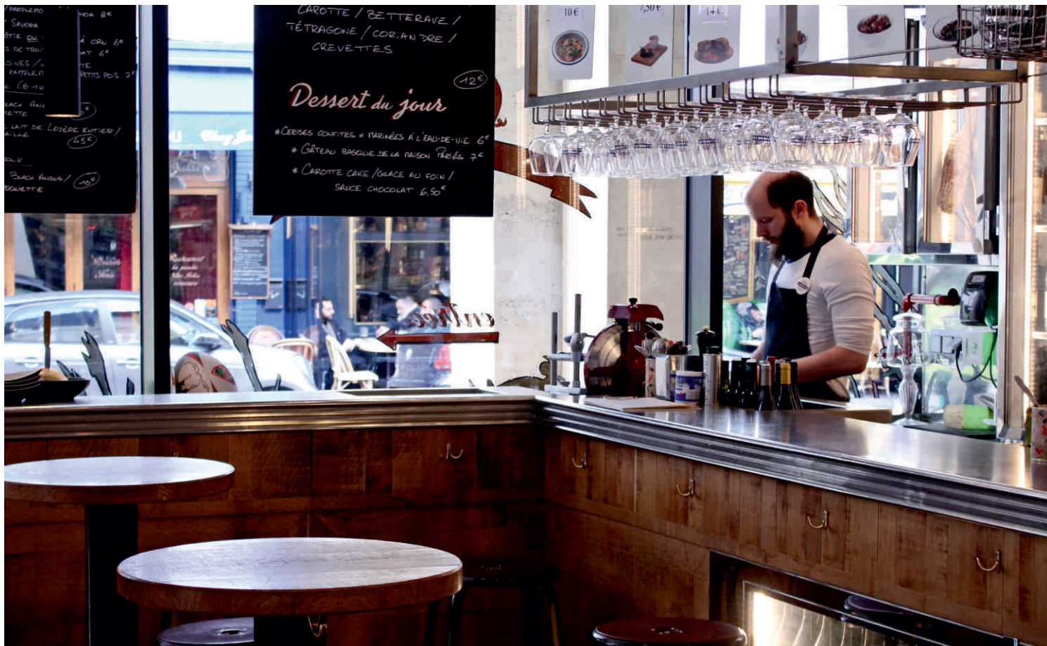
L'AVANT COMPTOIR DU MARCHÉ - Yves Camdeborde Bordure n°19