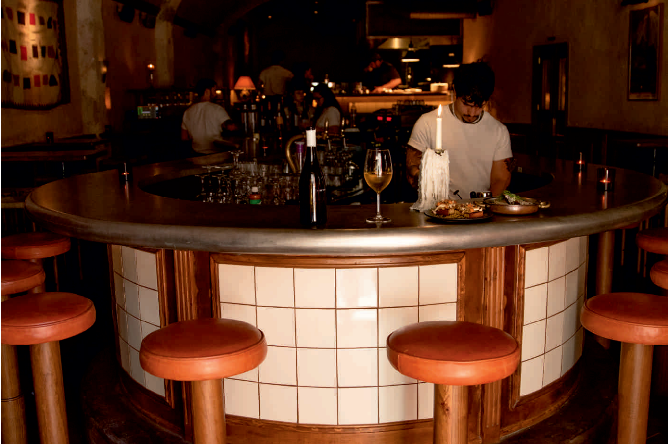
COSMO, LISBONNE Bordure sur mesure, demi-ronde