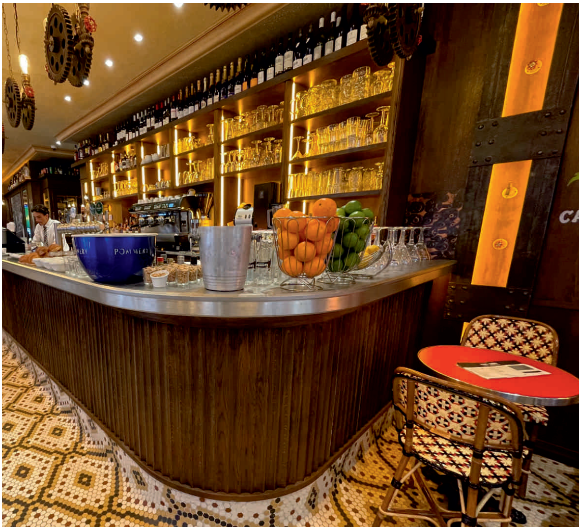
PARIS AUBER CAFE Bordure n°103