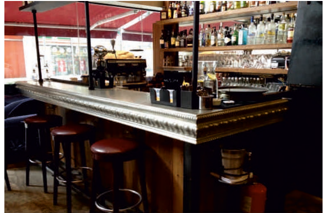
THE PRESS ROOM, HONG KONG Bordure n°1

We export almost 40% of our production. Our projects span from the United States to Japan, from Dubai to Australia and across Europe.