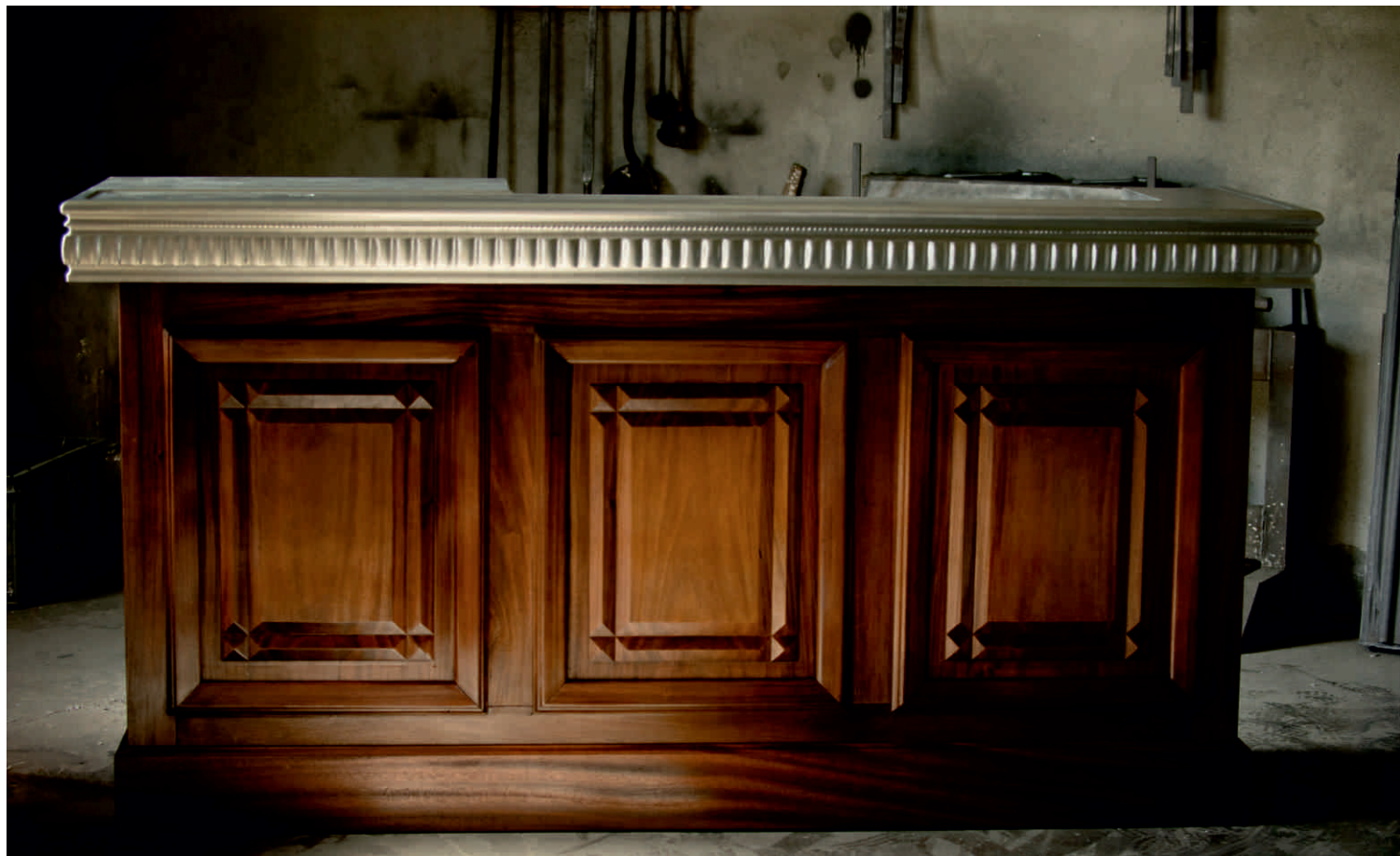
COMPTOIR DE 1929 EN ACAJOU MASSIF Façades du comptoir d'origine de l'hôtel Splendid à DAX Bordure n°25