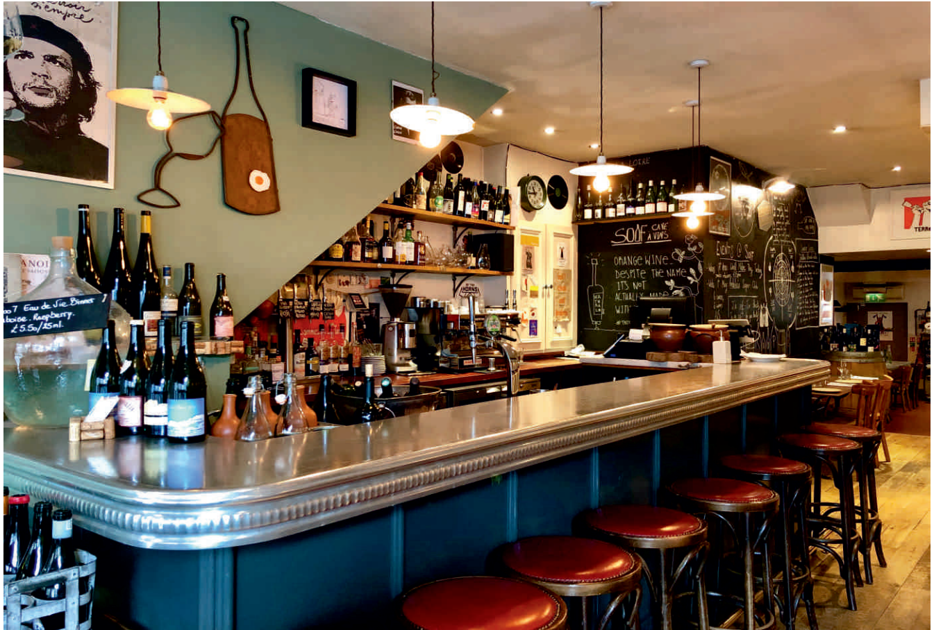
SOIF, LONDRES Barrière n°8