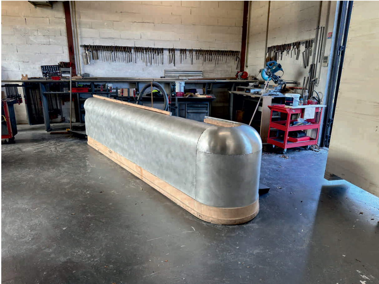
MEUBLE SUR MESURE, CRÈME DE PARIS