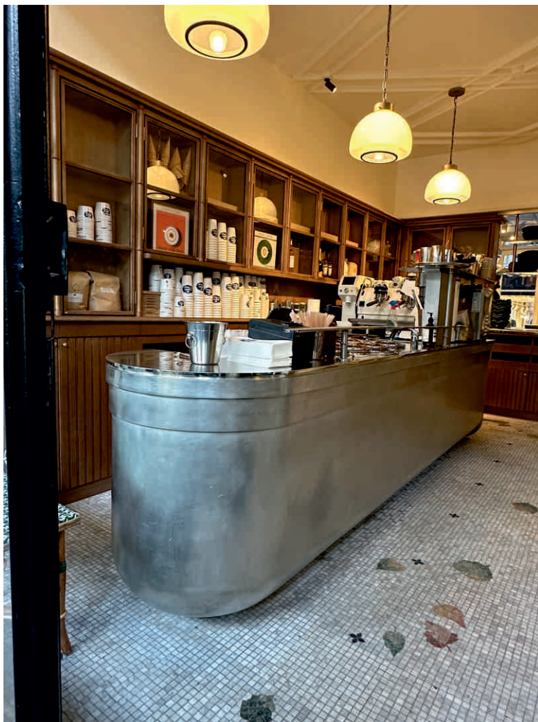
MEUBLE SUR MESURE, CRÈME DE PARIS