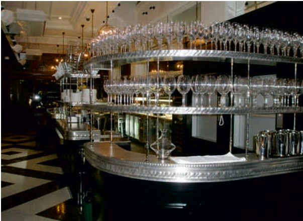
PERTH, AUSTRALIE Bordure n°6

Nous exportons nos comptoirs : nos projets s'étendent des États-Unis au Japon, en passant par Dubaï jusqu'à l'Australie, ainsi que dans toute l'Europe.