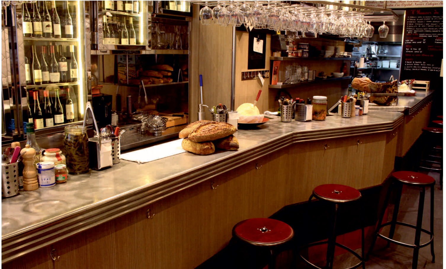
L'AVANT COMPTOIR DU MARCHÉ - Yves Camdeborde Bordure n°19