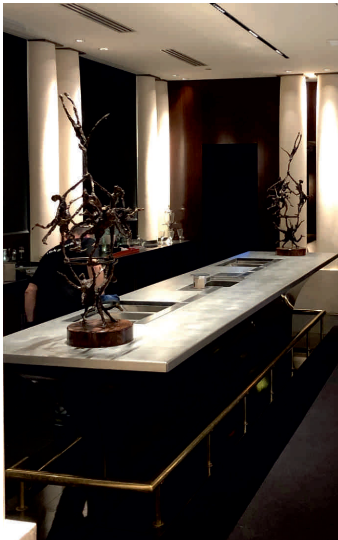
PARK HYATT PARIS-VENDÔME Bordure sur mesure, plate