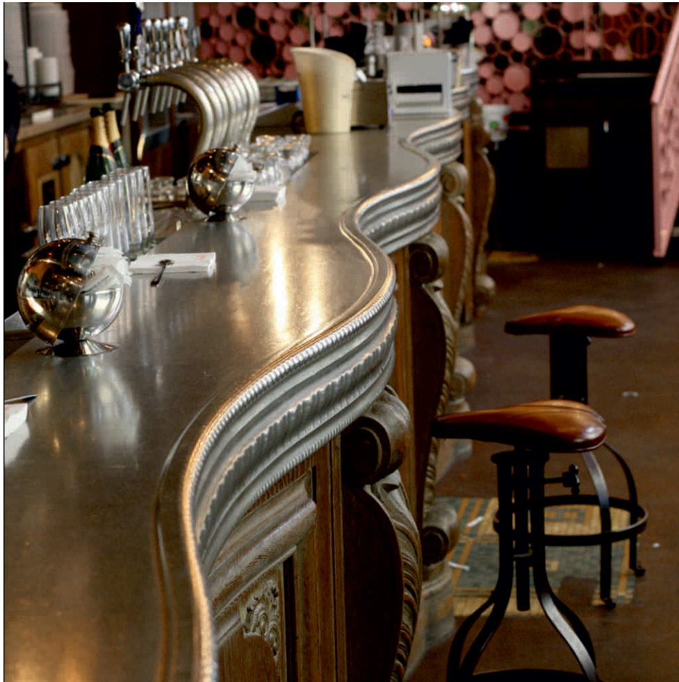
LE BREBANT Bordure n°6