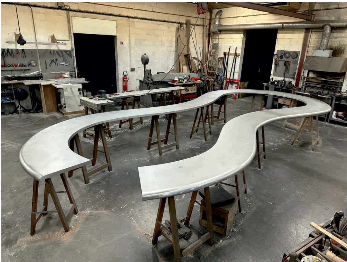
COSMO, LISBONNE Bordure sur mesure, demi-ronde