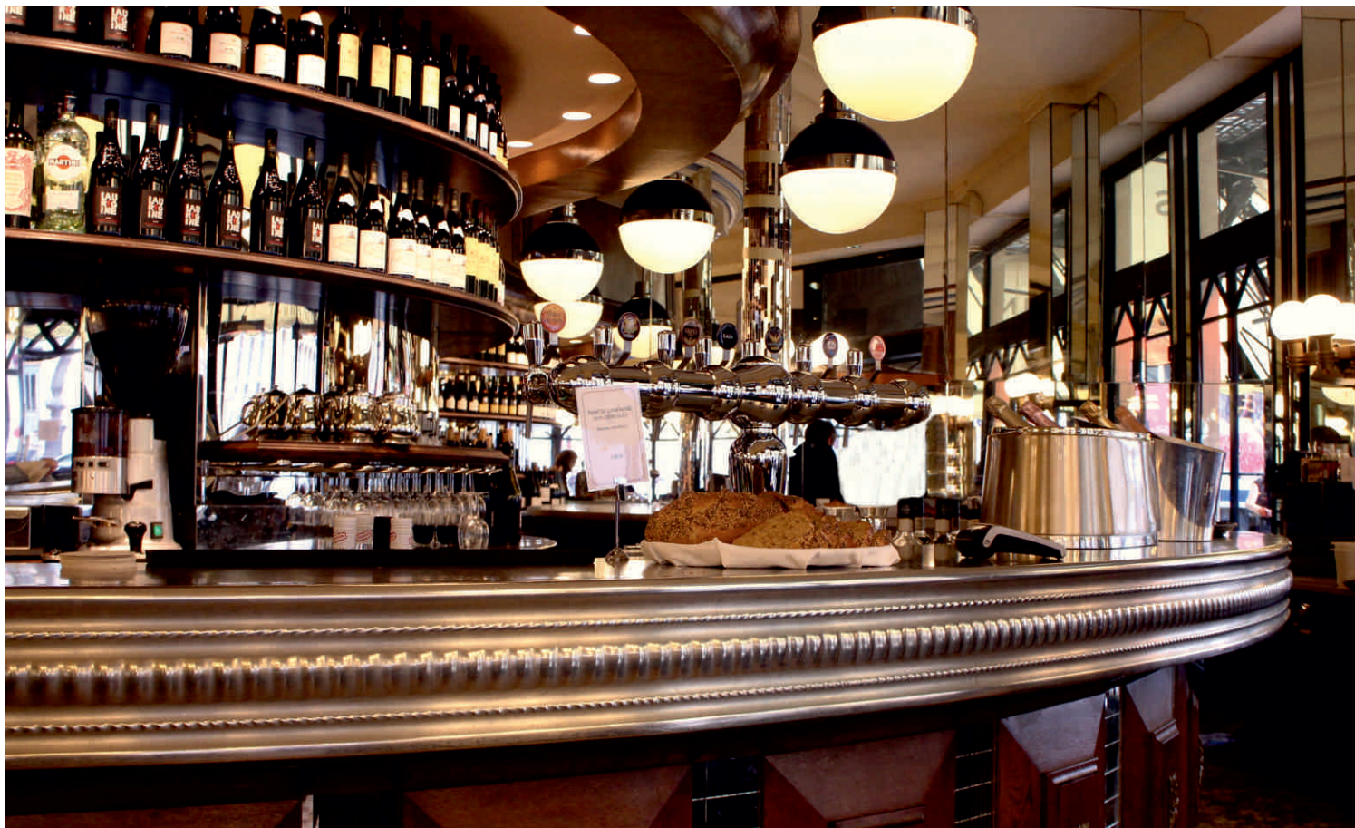
TERMINUS NORD Bordure n°27