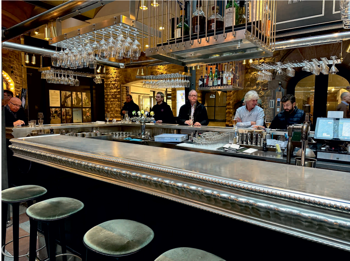
TURES, STOCKHOLM Bordure n°1