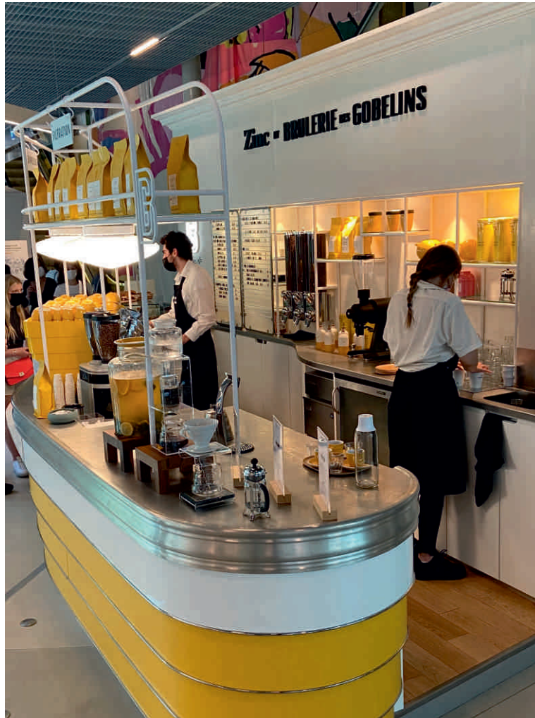
LA SAMARITAINE Bordure n°2