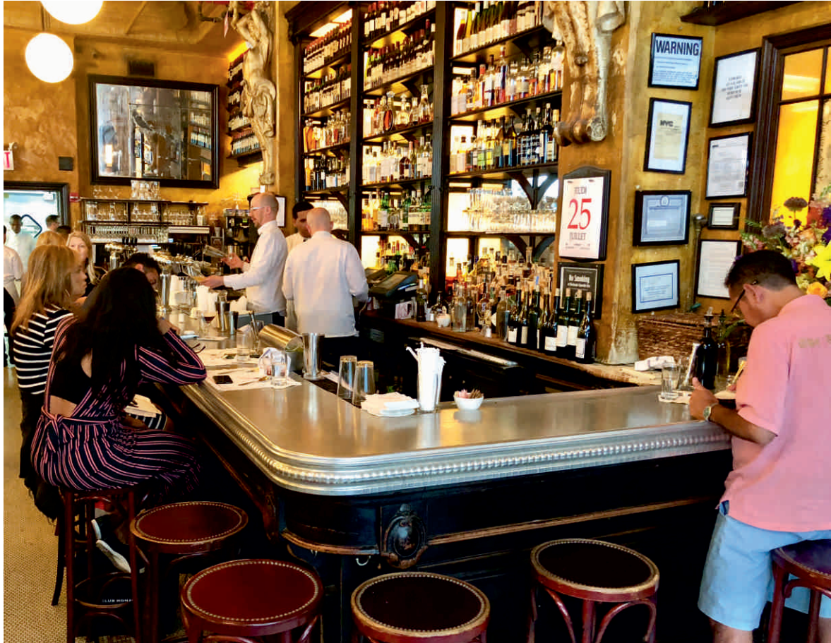
BALTHAZAR, NEW YORK Bordure n°7