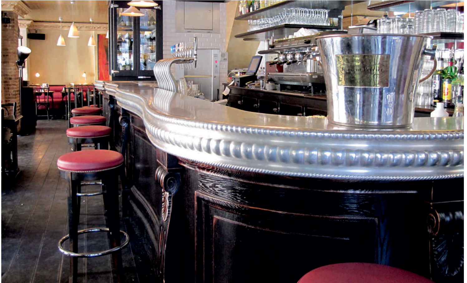
LE PLEIN SOLEIL Bordure n°26