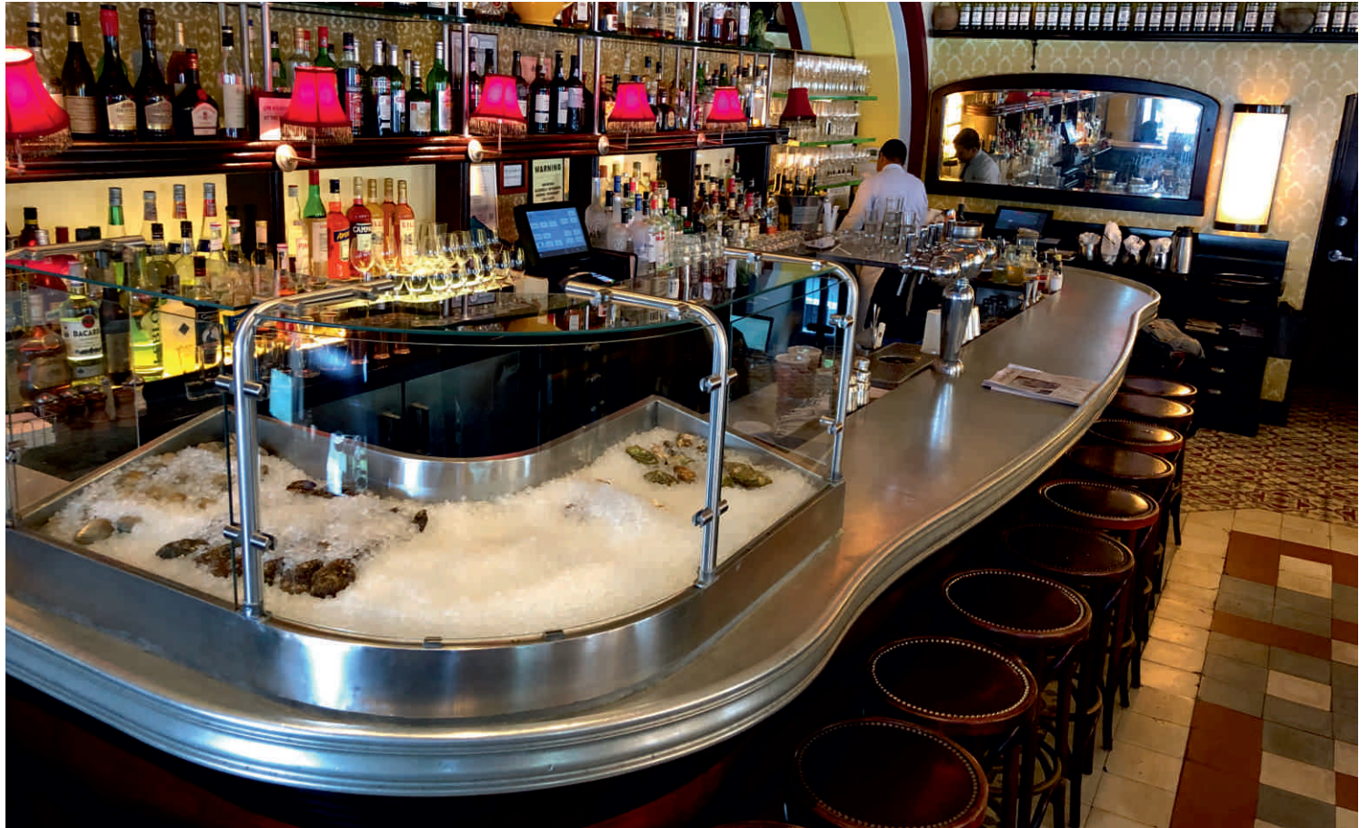
MARSEILLE, NEW YORK Bordure n°15