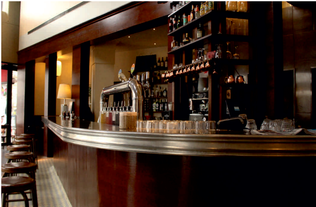
LA CANTINE DE LA CIGALE Bordure n°15