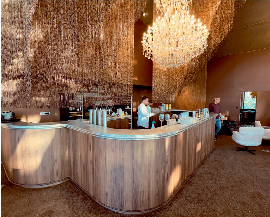
LE ROUF Bordure n°9