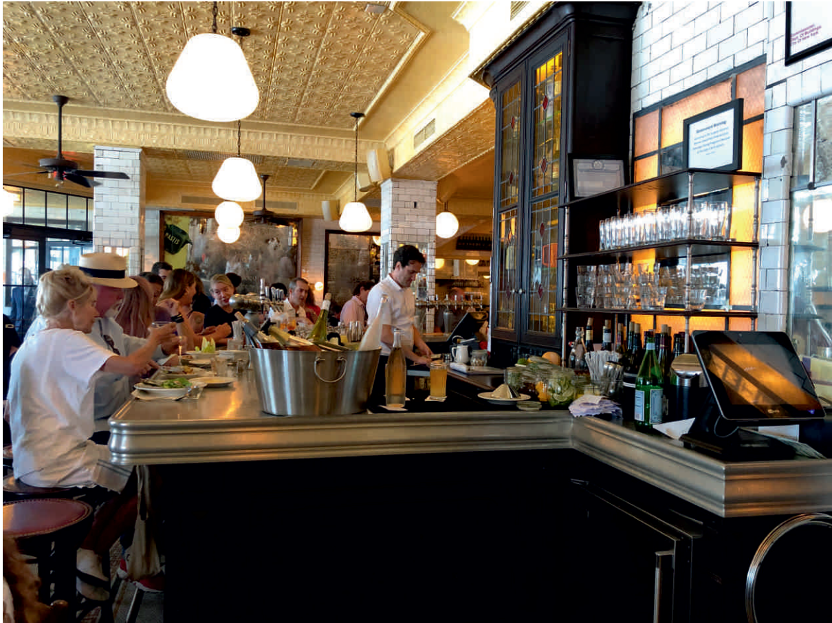
PASTIS, NEW YORK Bordure n°18