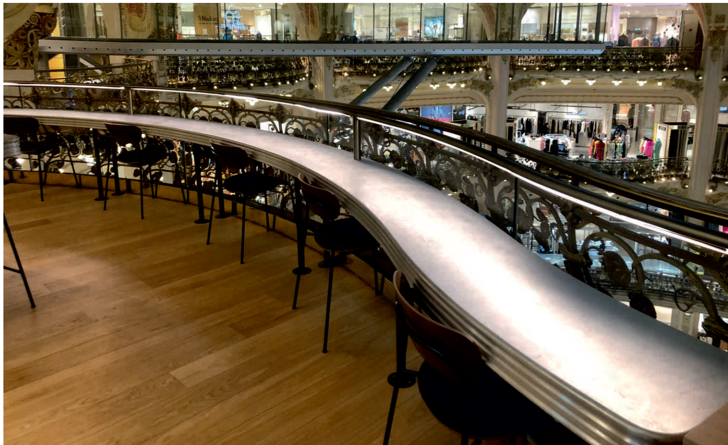
CAFÉ COUTUME, GALERIES LAFAYETTE Bordure n°19